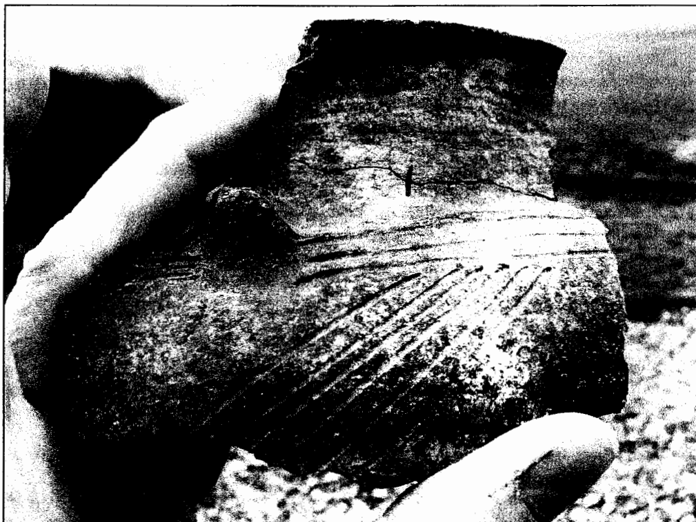
Fig. 3. Scherf Ruinen-Wommels I aardewerk.

de groeven werd de spatel aan de bovenzijde relatief diep ingedrukt. Bovendien is een klein bandoor op de overgang schouder-hals aangebracht. Al deze kenmerken treft men aan bij aardewerk uit een aantal vroege, 6 e -eeuwse kweldernederzettingen – nog geen terpen! – in Friesland en het naburige Duitse Reiderland. Vergelijkbare vondsten in Groningen stamden tot dusver uit De Brillerij (ZW van Garnwerd) en vooral Middelstum-Boerdamsterweg, waar ze bij een opgraving in de jaren '70 in flinke aantallen zijn aangetroffen. Het centrum van de verschillende stijlelementen moet gezocht worden in Nedersachsen.