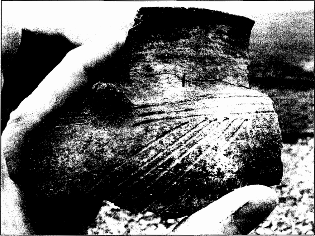
Fig. 3. Scherf Ruinen-Wommels I aardewerk (foto B. Westerink).

de groeven werd de spatel aan de bovenzijde relatief diep ingedrukt. Bovendien is een klein bandoor op de overgang schouder-hals aangebracht. Al deze kenmerken treft men aan bij aardewerk uit een aantal vroege, 6 e -eeuwse kweldernederzettingen – nog geen terpen! – in Friesland en het naburige Duitse Reiderland. Vergelijkbare vondsten in Groningen stamden tot dusver uit De Brillerij (ZW van Garnwerd) en vooral Middelstum-Boerdamsterweg, waar ze bij een opgraving in de jaren '70 in flinke aantallen zijn aangetroffen. Het centrum van de verschillende stijlelementen moet gezocht worden in Niedersachsen.