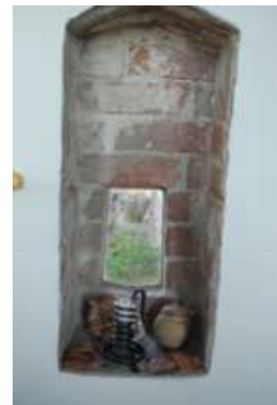
Na de restauratie

De functie van de nissen is niet duidelijk. Een kaarsennis is een mogelijke verklaring. Er kunnen ook heiligenbeelden in hebben gestaan. Het huis kan een representatieve religieuze functie hebben gehad. De aanwezigheid van een piscina – waarin gewijd water werd bewaard – is hiervoor een aanwijzing.