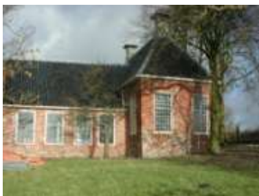
Na de restauratie