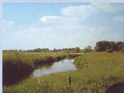
Het Dommeldal

Zoals de naam al zegt, bestaat een erfgoedplan uit twee componenten: een erfgoeddeel en een plandeel. In het erfgoeddeel wordt een inventarisatie van de huidige staat van het erfgoed in een gebied gemaakt. Het gaat dus om het huidige, aanwezige erfgoed en niet over verdwenen zaken. En het gaat daarbij om een integrale inventarisatie: er wordt gekeken naar de archeologie, historische landschappen, historische stedenbouw en historische bouwkunst, ook in onderlinge samenhang.