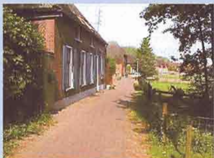
De paden van Lith [uit: Erfgoedplan Lith]

In het plandeel wordt weergegeven hoe er in de toekomst wordt omgegaan met al dat moois: Hoe het erfgoed een plaats kan krijgen in de ruimtelijke ordening; hoe het erfgoed kan worden ingezet bij de ontwikkeling van recreatie en toerisme, educatie en landschapsontwikkeling en de plattelandsreconstructie. Het begrip erfgoedplan werd in 1999 door Adviesbureau Cuijpers geïntroduceerd bij het opzetten van een integraal cultuurhistorisch beleid voor de gemeente Lith, waar in 2001 een het eerste erfgoedplan van Nederland gereed kwam en werd vastgesteld door de gemeenteraad.