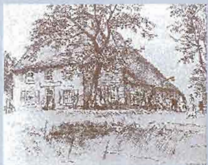
Het Zevenbergse Huis in 1933 [uit: Erfgoedplan Oss]

Wat doen dan die oude appelbomen vlakbij deze plaats temidden van de nieuwe beplanting?