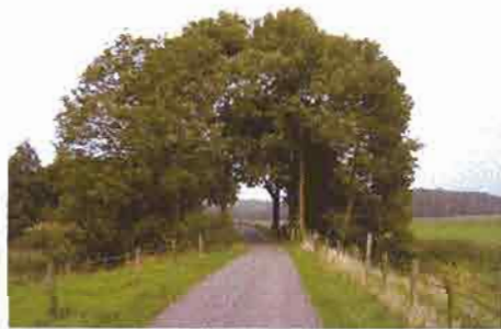
De Elshoutse Zeedijk

Adviesbureau Cuijpers is gevraagd een cultuurhistorische rapportage te verzorgen, alsmede een integraal plan op te stellen ten behoeve van het behoud en het benutten van dit erfgoed.