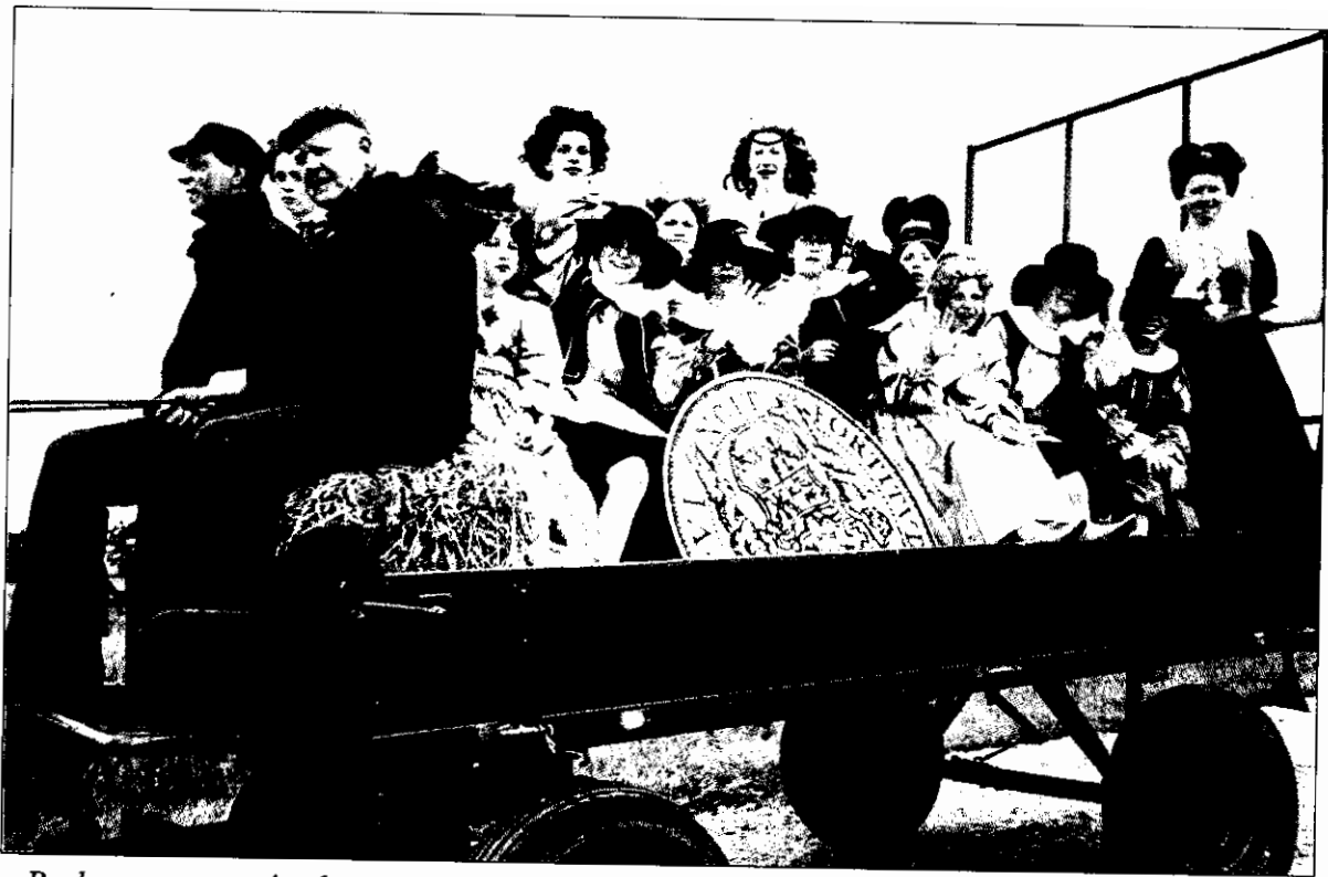
■ Per boerenwagen ging het met een grote daalder richting Harssensbosch.