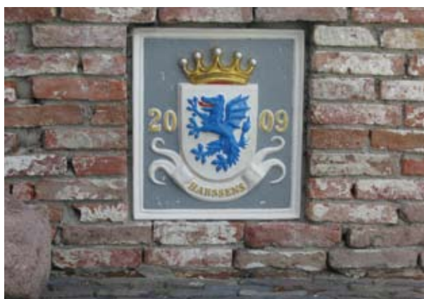
Wapenstein met het wapen van de heerlijkheid Harssens, ingemetseld in een muurtje achter het keuterijtje Harssensbosch. Door de Stichting Heerlijkheid Harssens bij de oplevering geschonken aan Stichting Groninger Landschap (2009).