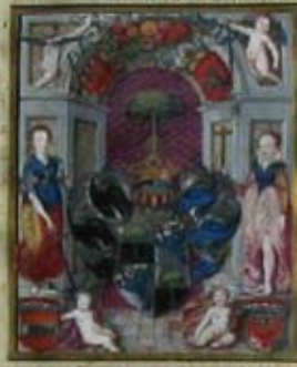
Adelsdiploma van keizer Rudolf II voor Warmolt Hillebrandes betreffende de verheffing van hem en zijn afstammelingen in de adelstand (1604). Collectie RHC Groninger Archieven. Foto: auteur.