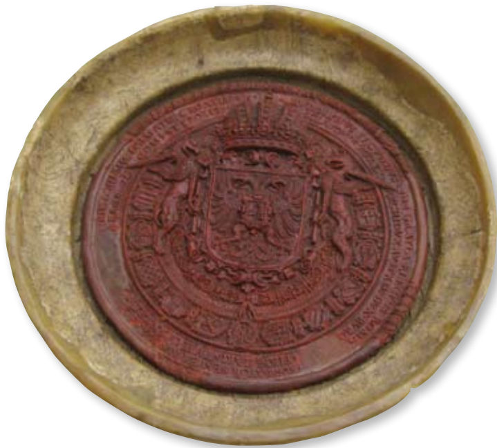
Majesteitszegel van Rudolf II onder het adelsdiploma van Warmolt Hillebrandes. Met een diameter van 166 millimeter is dit zegel het grootste zegel uit de Groninger Archieven.

mogelijk een wandeling te maken over de singels van de voormalige borg en te ervaren hoe groot deze wel was. De aanleg van deze borg op een voormalige dorpswierde moet in de vroege zestiende eeuw een geweldig karwei zijn geweest. De beide borgterreinen vormen een unieke archeologische locatie: een dergelijke combinatie komt in Groningen verder niet voor.