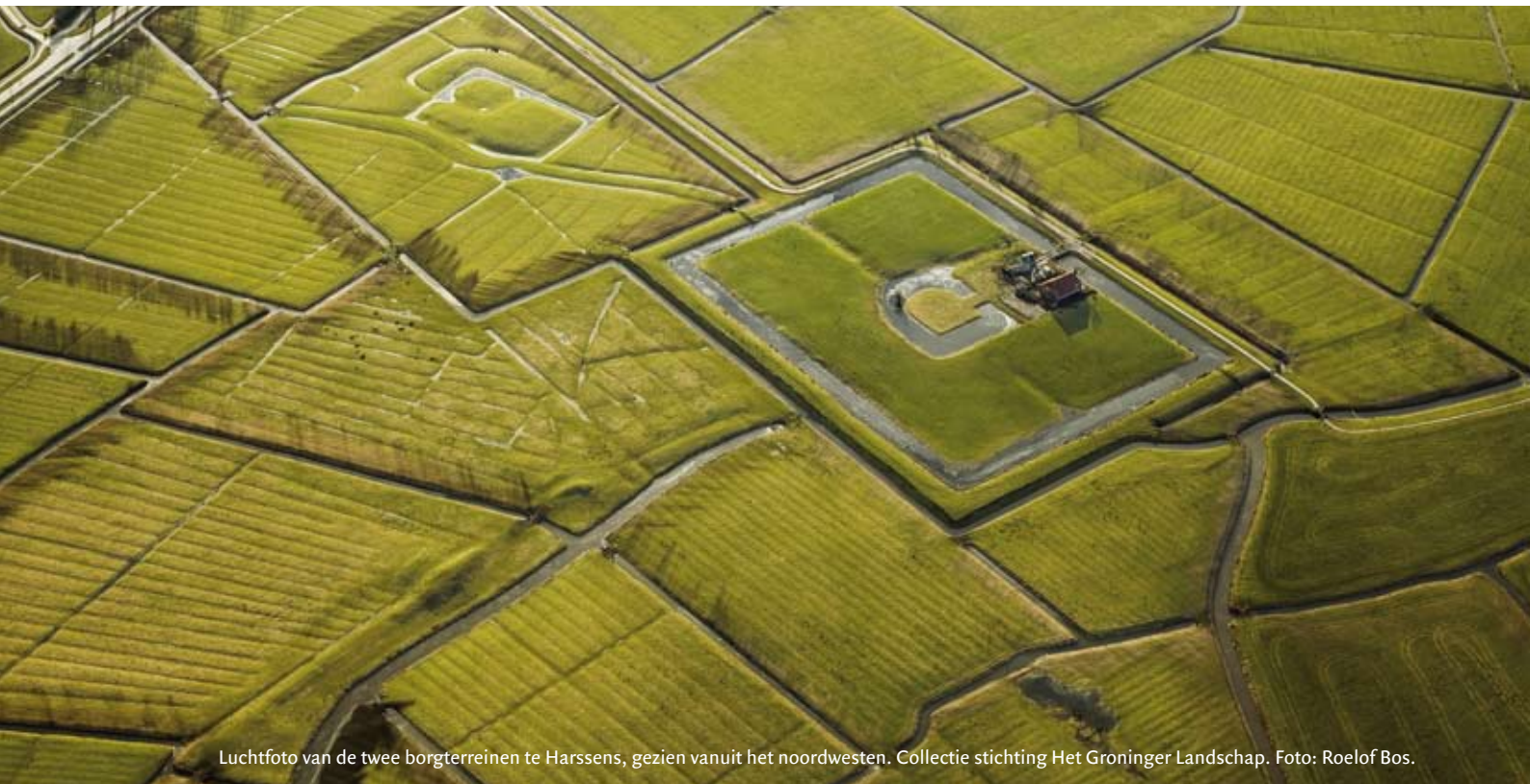
Luchtfoto van de twee borgterreinen te Harssens, gezien vanuit het noordwesten.

over zijn persoonlijke verhoudingen, was hij getrouwd en had hij kinderen? Internet bleek een prachtig hulpmiddel om de speld in de historische hooiberg te vinden. Vooral Google-books leverde een schat aan gegevens op. Uit deze gegevens en correspondentie met het Staatsarchief in Wenen valt de volgende levensloop van Menolt Hillebrandes te destilleren. 17