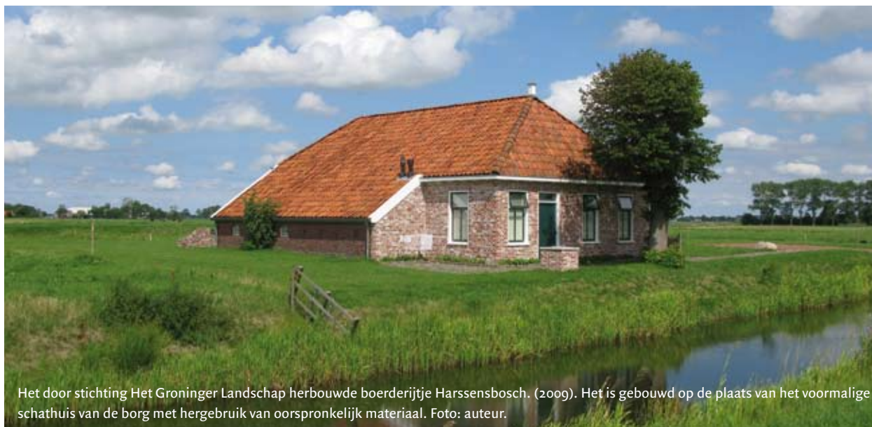
Het door stichting Het Groninger Landschap herbouwde boerderijtje Harssensbosch. (2009). Het is gebouwd op de plaats van het voormalige schathuis van de borg met hergebruik van oorspronkelijk materiaal.

en teruggave van de geconfiscerde goederen. De keizer installeerde in Moravië een commissie die de aanspraken van de gedupeerden moest beoordelen en daarbij uiteraard de belangen van de keizer in deze zaak moest bewaken. Eén van de commissarissen was, zoals een stuk van 2 maart 1629 aangeeft, ‘unnser[m] Kammerer Menoldo Hillebranden von Harsens’ . 20